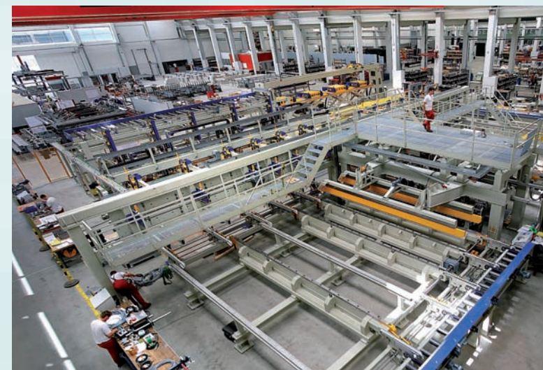
Blick in die Montagehalle von Fill

In einer rund neunmonatigen Implementierungsphase arbeitete das Projektteam die ersten Simulationen aus und erstellte parallel die Modelle für einen standardisierten Komponentenkatalog. Während