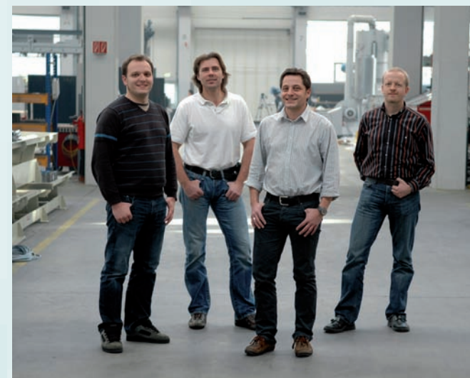
Das Simulations-Team von Fill

Daher fiel im Unternehmen rasch die Entscheidung, eine eigene Simulationssoftware anzuschaffen. Während einer Evaluierungsphase sammelte das Team zu-