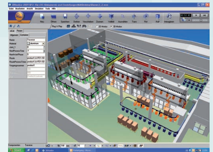
Die hohe Detailgenauigkeit macht realitätsnahe 3D-Simulationen von Fertigungsprozessen möglich

„In einer Anlage zur Lackierung von Großgetrieben konnten wir anhand dieser Simulationsmethoden bei-