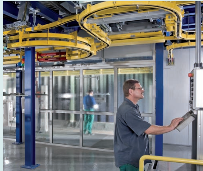
Wincor Nixdorf Lackieranlage