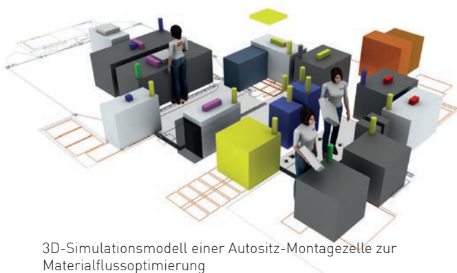
3D-Simulationsmodell einer Autositz-Montagezelle zur Materialflussoptimierung

Im Detail handelt es sich um die Produkte 3DCreate und 3DRealize, die ihre Anwendung bei Faurecia finden. Das Fabrikplanungstool 3DCreate ermöglicht es, eigene Komponentenbibliotheken zur Simulation zu erstellen. Mittels zuvor definierter Menüpunkte lassen sich die Rohdaten mit entsprechenden simulationsrelevanten