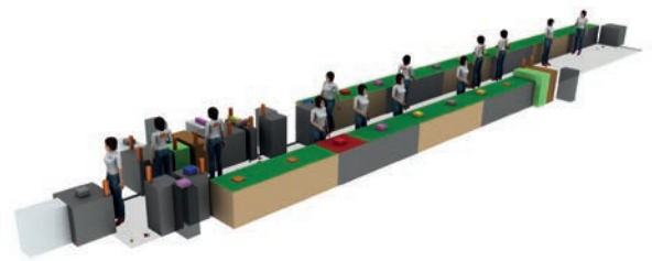
3D-Modell einer Continuous Flow Montagelinie für Autositze

Faurecia simuliert dabei insbesondere manuelle Fertigungsprozesse und ermöglicht die ideale Planung für den jeweiligen Mitarbeiter und seine Arbeitsinhalte. Die Komponentenbibliothek besitzt einen starken Fokus auf die Simulation von Bedienern, deren Zuordnung zu Arbeitsplätzen und die damit verbundene Materialversorgung. Der Simulator ermöglicht dabei die Anordnung einzelner Arbeitsplätze und Prozesse im Layout sowie die Validierung von Kapazitäten und Laufwegen.